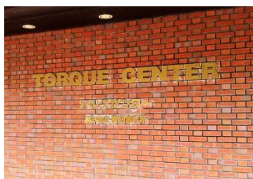
本社エントランス