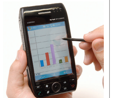
どこにいてもリアルタイムに販売・在庫状況を確認して迅速な販売戦略を立てられる「PlusONE」

用負荷に必要なランニングコストも無視できない。 そこで、自前でサーバーを設置しにくい企業に対しては、ASP(ソフトウェアの期間貸し)サービスを用意。専門知識や技術が求められるサーバーの構築やメンテナンス、運用、セキュリティ対策などはすべてAISに一任しながら、アプリケーションを自由に利用することができる。 しかもこのサービスは、極めてリーズナブルな価格で提供される。年間コストは約24万円。サーバー管理専任者一人の1カ月分の人件費にも満たない金額で、1年間万全のモバイルサービスを利用できる。 ASPサービスは、コストパフォーマンスの面から見ても、大変有利なプランだ。例えば、まず特定の店舗や部門で試験導入を図り、その成果を基盤に逐次水平展開を進めるといったスモールスタートも可能だ。この機会に是非検討してみたい。